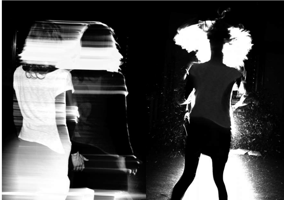
Be-Fore (Sometimes I feel like a motherless child) – solo, mise en bouche de Blue-S-Cat

La nouvelle création de la cie donne suite aux deux premiers spectacles ( One Shoot et XXY ), comme le troisième volet d'une trilogie autour de cinq grands questionnements dans lesquels s'inscrit l'humain de nos sociétés contemporaines :